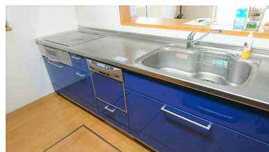
IHコンロ 食洗機付き